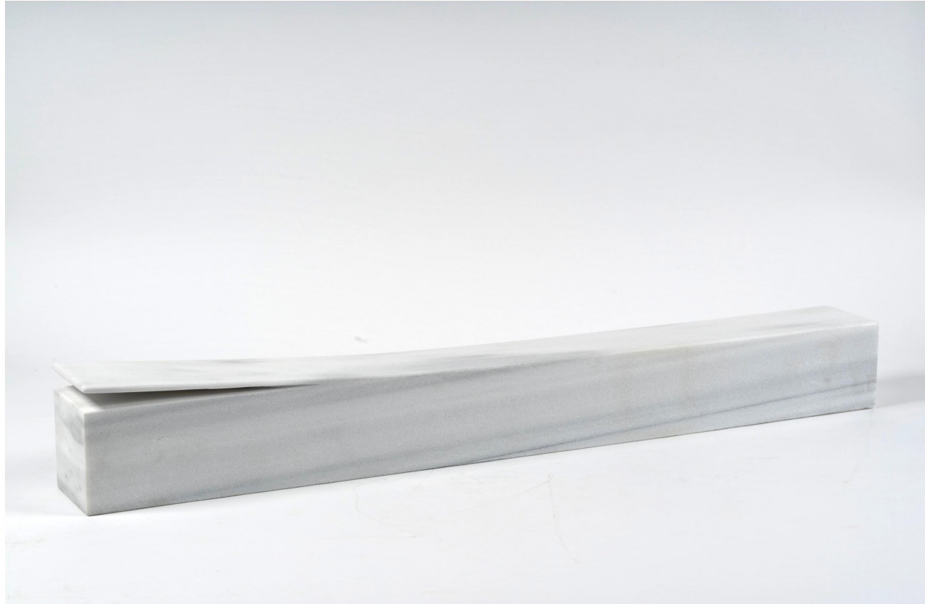
Metin Alper Kurt Untitled / Isimsiz, 2023 Marble / Mermer 103 x 16 x 14 cm The Yard - 6