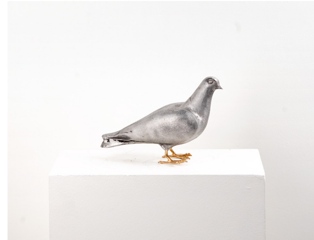
Bilal Hakan Karakaya Untitled / İsimsiz, 2023 Alüminyum / Aluminium 18 x 11 x 29 cm The Yard - 1