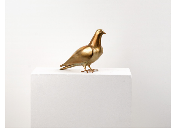
Bilal Hakan Karakaya Untitled / İsimsiz, 2023 Bronz / Bronze 19 x 11 x 28 cm The Yard - 1