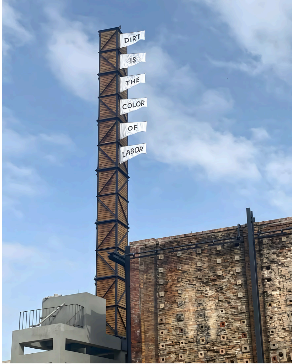
Bilal Yılmaz Dirt is the color of labor / Kir emeğin rengidir, 2022 The Yard - 8