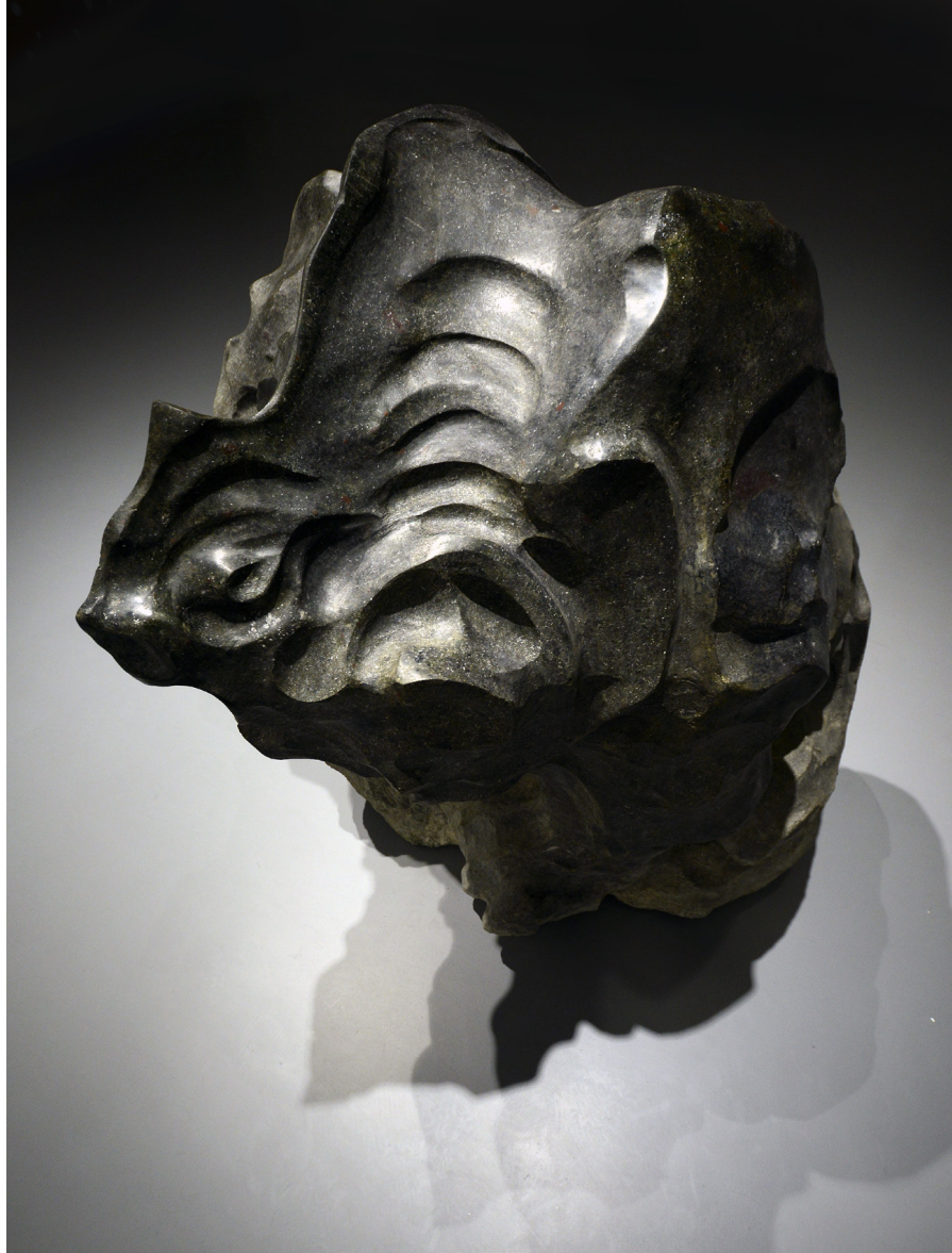
Kazım Karakaya Animal / Hayvan, 2012 Basalt / Bazalt 123 x 100 x 90 cm The Yard - 6