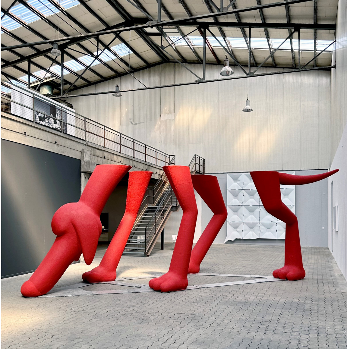
Erdil Yaşaroğlu Stray Dog / Sokak Köpeği, 2023 Polyester, Metal, Concrete / Polyester, Metal, Beton 300 x 900 x 300 cm The Yard - 4