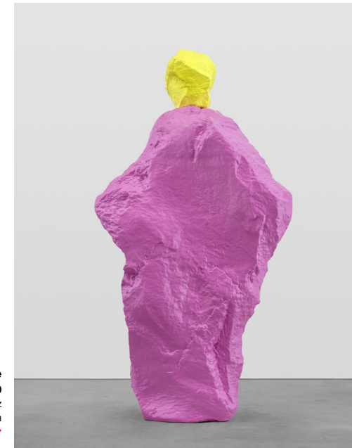
Ugo Rondinone Yellow Pink Monk, Sarı Pembe Rahip, 2020 Painted Bronze / Boyanmış Bronz 293 x 156.8 x 80 cm The Yard - 7