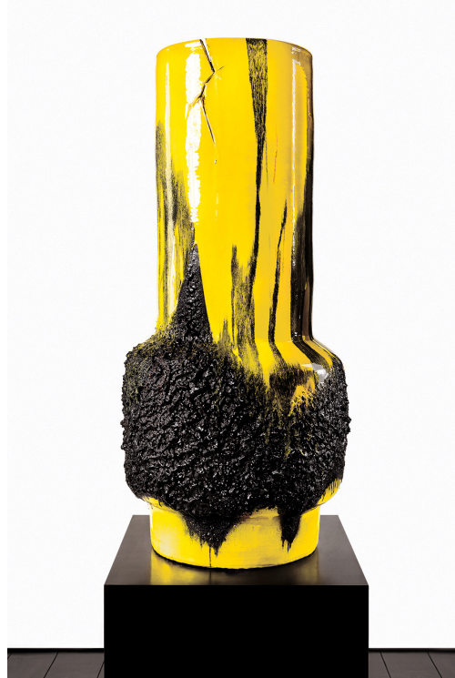
Anselm Reyle Bittersweet Homecoming, 2017 Glazed ceramics, plinth stainless steel / Seramik, Paslanmaz Çelik Height / Yükseklik: 166 cm Ø 75 cm Plinth / Kaide: 65 x 105 x 105 cm The Yard - 5