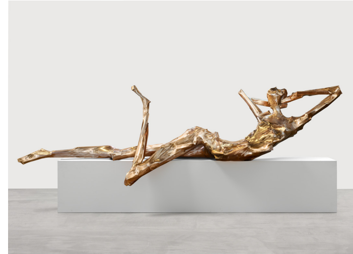
Georg Herold Untitled / İsimsiz, 2023 Bronze, lacquer / Bronz, vernik 120 x 430 x 165 cm Edition 1 / 3 + 2 AP The Yard - 6