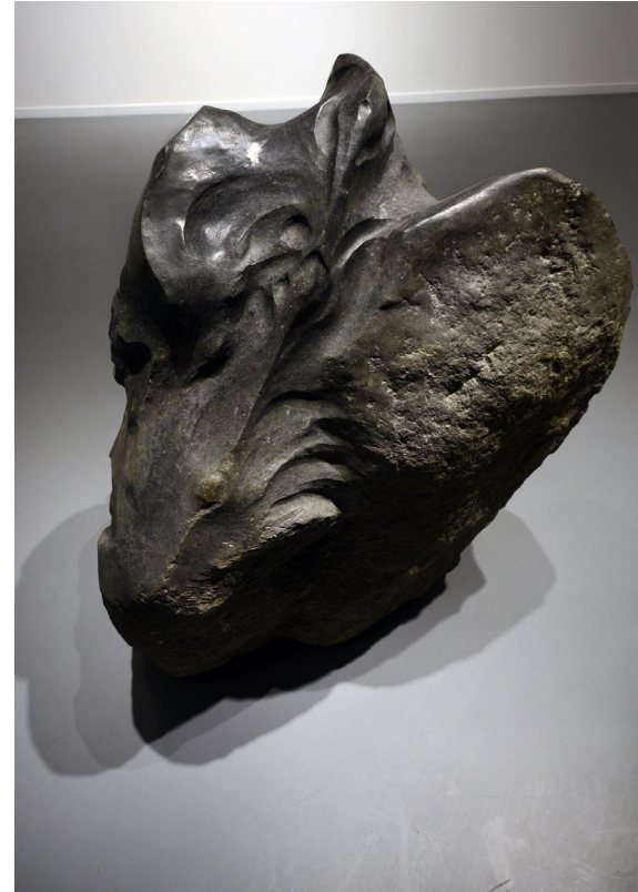
Kazım Karakaya Animal / Hayvan, 2012 (Rear / Arka) Basalt / Bazalt 123 x 100 x 90 cm The Yard - 6