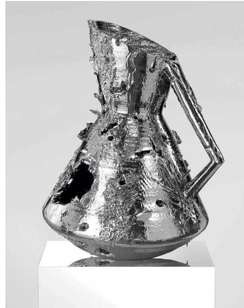
Anselm Reyle Zodiac Apocalypse, 2023 Ceramics, bright, platinum silver, plinth, stainless steel / Seramik, gümüş, paslanmaz çelik Height / Yükseklik: 144 cm Ø 102 cm Plinth / Kaide: 85 x 105 x 105 cm The Yard - 5