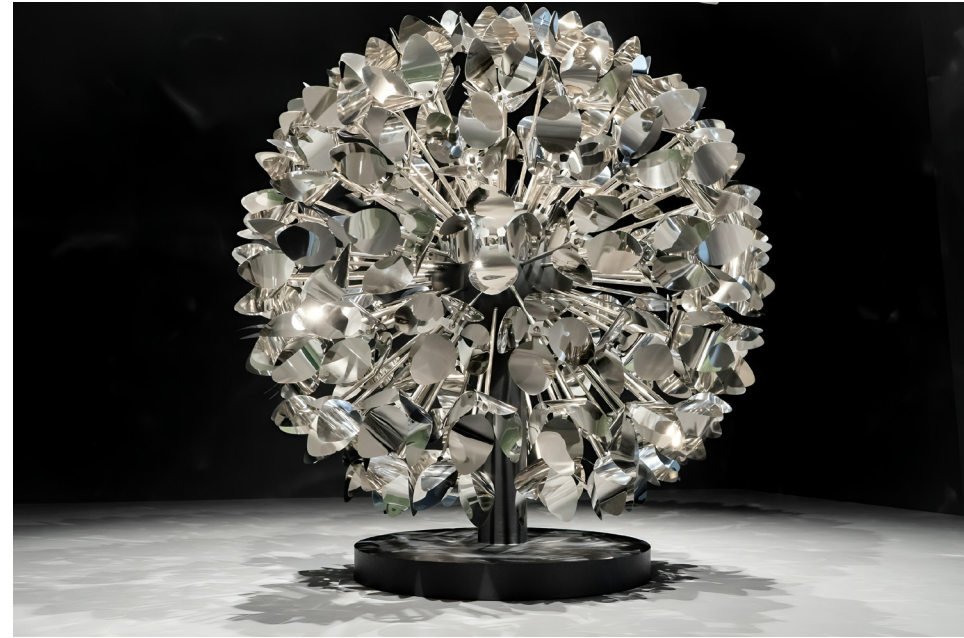
Onur Mansız Esfera, 2023 Stainless Steel / Paslanmaz Çelik 200 cm (Ø) The Yard - 4