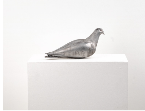
Bilal Hakan Karakaya Untitled / İsimsiz, 2023 Alüminyum / Aluminium 13 x 11 x 29 cm The Yard - 1