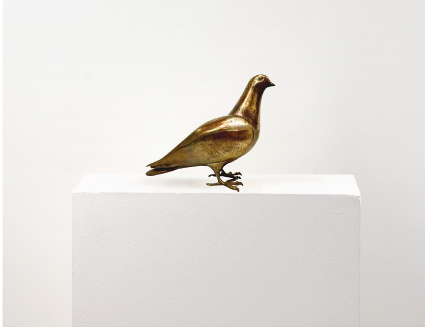
Bilal Hakan Karakaya Untitled / İsimsiz, 2023 Bronz / Bronze 19 x 10 x 21 cm The Yard - 1