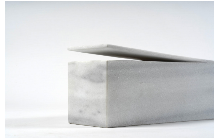
Metin Alper Kurt Untitled / Isimsiz, 2023 (Detail / Detay) Marble / Mermer 103 x 16 x 14 cm The Yard - 6