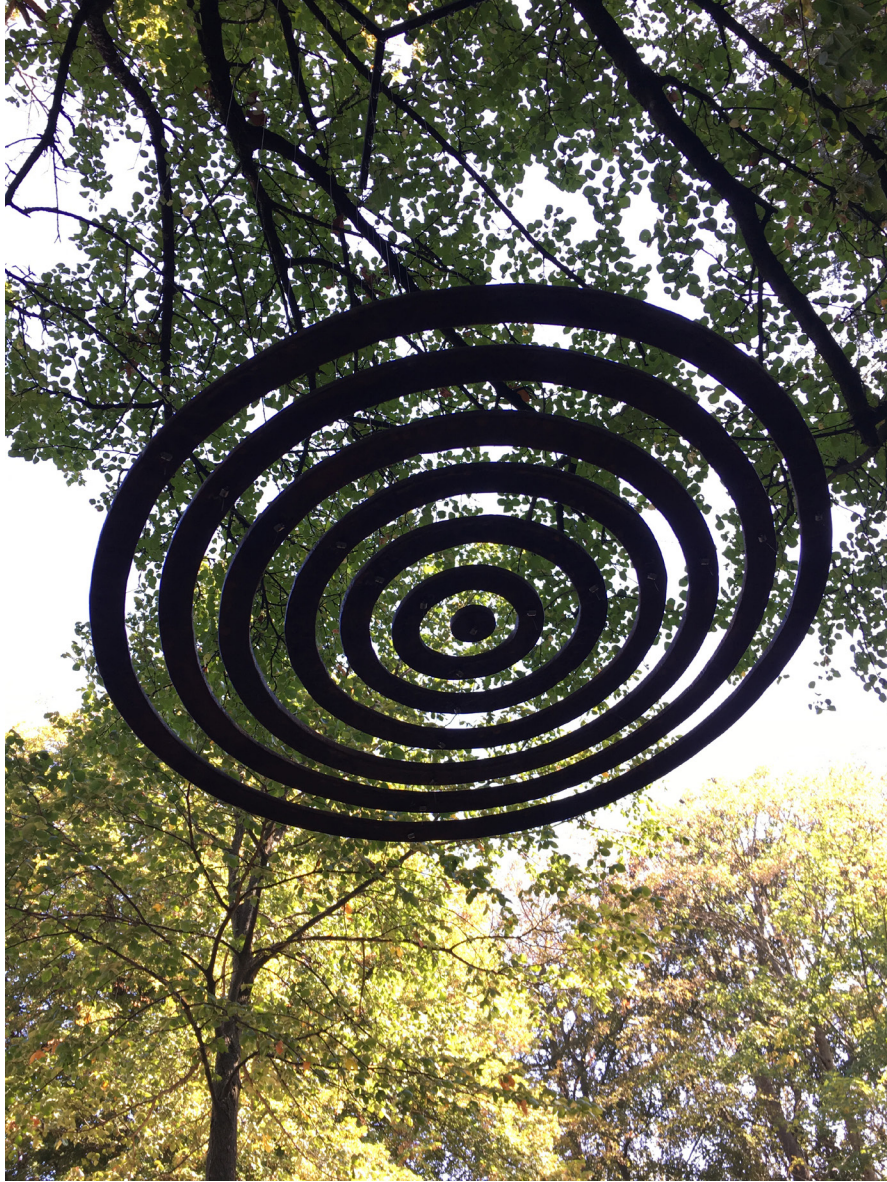
Étienne Krähenbühl Au Fil de l'O - VII / O'nun İzinde - VII, 2024 Corroded end forged steel / Paslanmış uçlu dövme çelik 600 cm, Ø 138 cm The Yard - 3