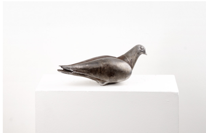
Bilal Hakan Karakaya Untitled / İsimsiz, 2023 Alüminyum / Aluminium 11.5 x 13 x 29 cm The Yard - 1