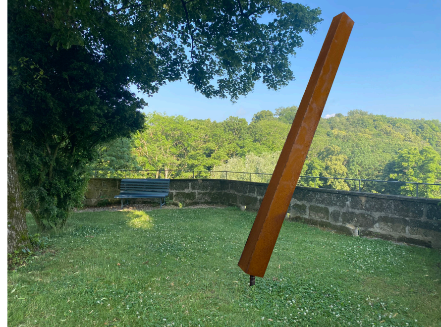
Étienne Krähenbühl Slash I, 2024 Corten Steel / Korten Çelik 300 x 21 x 21 cm, diameter movement / çap hareketi, 150 cm The Yard - 7